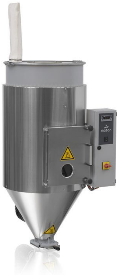
LUXOR HD 150