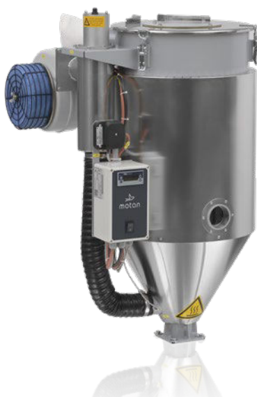
LUXOR HD 60